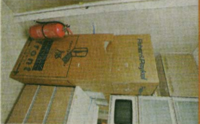
▲廚房內的雲櫃貼近滅火筒位置，阻礙開啟雲櫃。