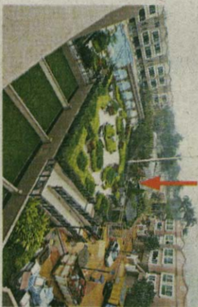
▲四季豪園設有休憩地方及泳池，但內裏卻包含由外界經營的花園（箭咀示）。