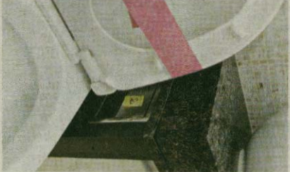
▲廁紙架與廁板太過貼近，難以放置紙巾。