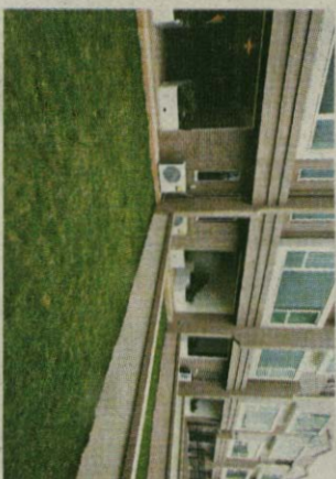
▲四季豪園每座皆設有私家花園，但花園之間只以矮牆分隔，小孩子亦可輕易跨過，私隱度略低。