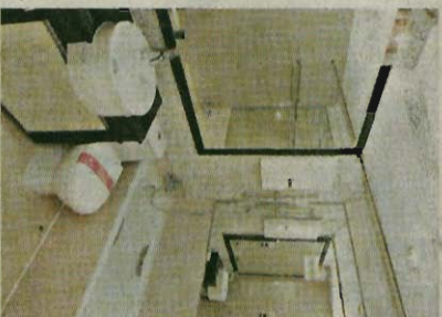
▲浴室設有水晶燈，並設有TC煤氣爐。