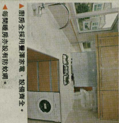
▲廚房全採用豐澤家電，設備齊全。