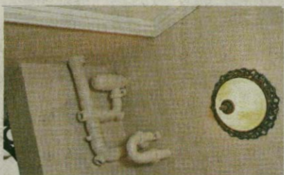
▲大門旁水管外露，影響外觀。