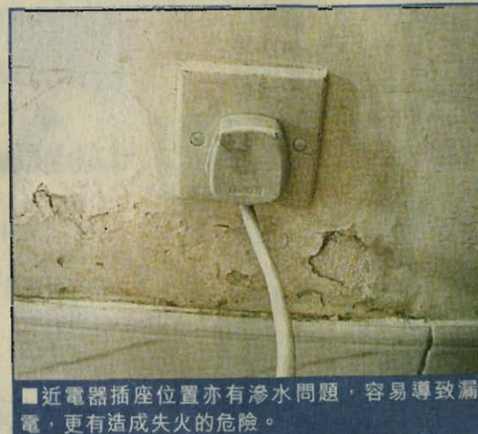
■近電器插座位置亦有滲水問題，容易導致漏電，更有造成失火的危險。

說：「若樓宇出現任何問題，房署應該及時解決，不可遲疑，以免導致漏電等嚴重問題出現。」他續道，房署應嚴謹地監管承辦商，以確保施工程序正確，從而令樓宇質素有保障。