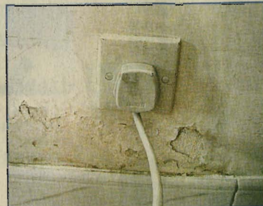
■近電器插座位置亦有滲水問題，容易導致漏電，更有造成失火的危險。

說：「若樓宇出現任何問題，房署應該及時解決，不可遲疑，以免導致漏電等嚴重問題出現。」他續道，房署應嚴謹地監管承辦商，以確保施工程序正確，從而令樓宇質素有保障。