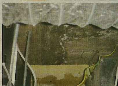
▲ 新入伙盤假天花遮掩的結構天花如有 白色結晶粒，日後會有滲水的機會較 大。

沒法打開，就無法檢查了，幸好大部 分落成的屋苑的浴室及廚房的假天花 都是容易打開的。